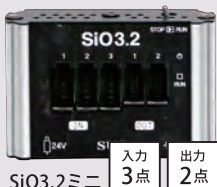
SiO3.2ミニ 入力3点 出力2点