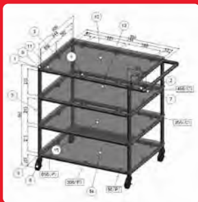
風船番号を追加した組立図

作成したモデルに風船番号や注記を追加した組立図を作成することができます。印刷した時の組み立てやすさが向上します。