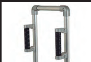
スベリ防止ラバーグリップ