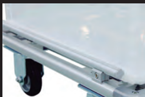
コンテナ落下防止(上下段)