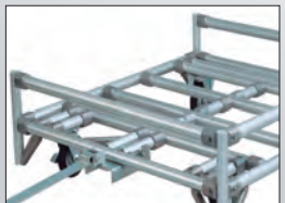
落下防止ガード (前、右、後)