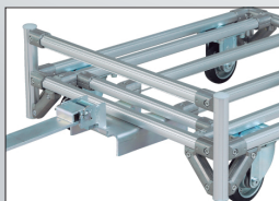
落下防止ガード (前後)