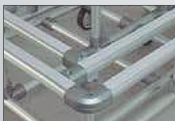
スベリ防止ラバー