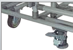
キャスター・ブレーキ