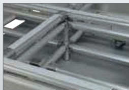
スベリ防止ラバー