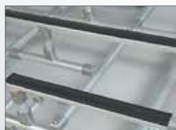
スベリ防止用ラバー