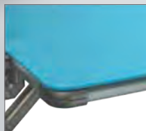
高密度発泡パネルで製品保護