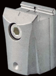
GFJ-000C マルチコネクタアウター型3